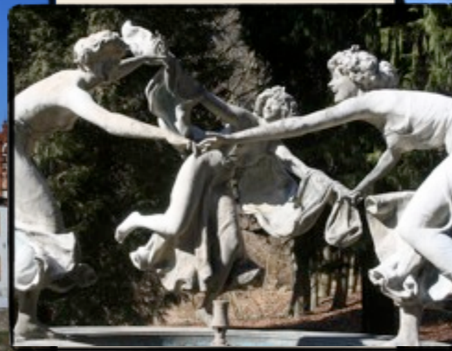
Brunnen Burg Schlitz